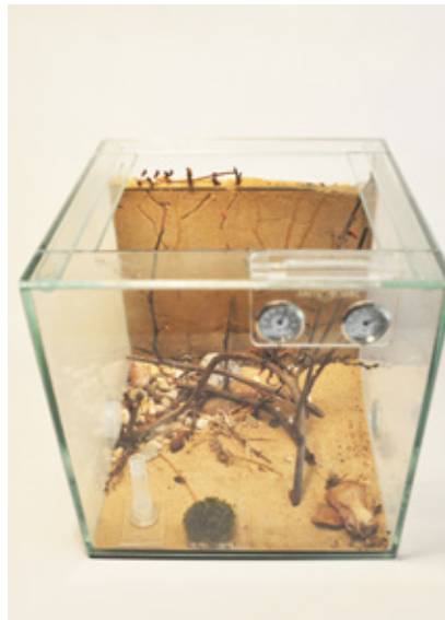
Formicarium fürs Volk: In diesem Terrarium lebt Rose mit ihrer Kolonie.