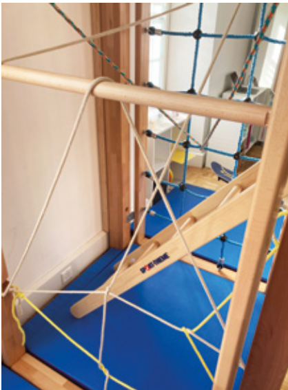
Motorische Herausforderung: Nachahmung eines Ameisenbaus