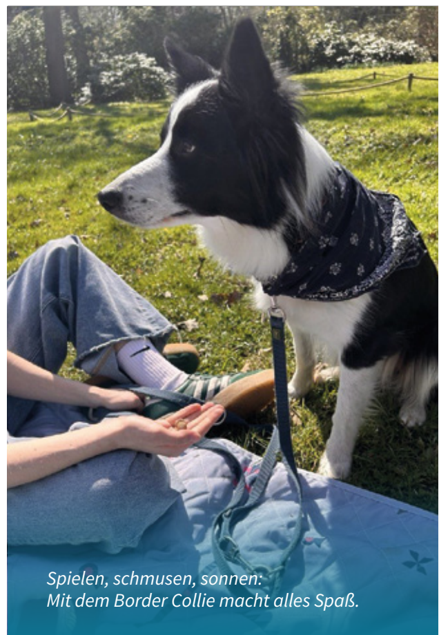
Spielen, schmusen, sonnen: Mit dem Border Collie macht alles Spaß.